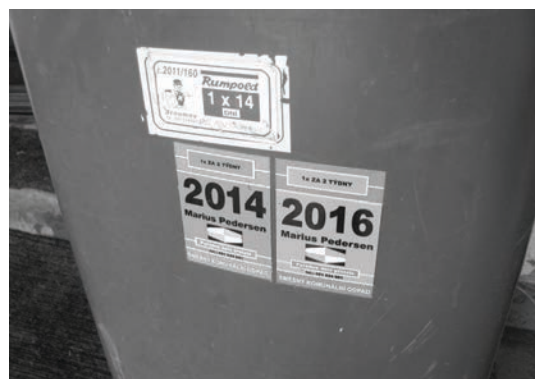
obr. č. 2 doklad o zaplacení poplatku