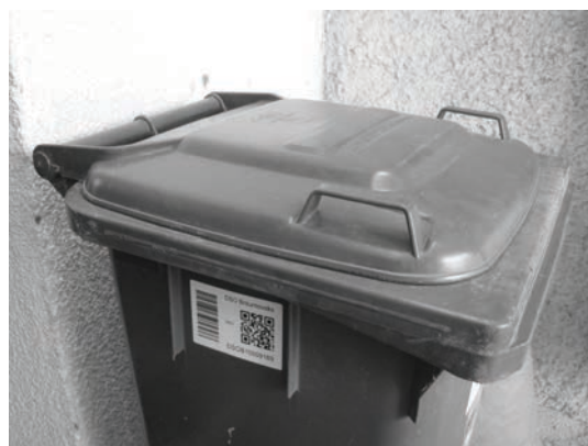
obr. č. 1 čárový kód

Pozor - neplést výše uvedené nálepky s čárovým kódem (jsou bílé - viz obr. č. 1) se žlutomodrou nálepkou - dokladem o zaplacení poplatku za svoz odpadu na příslušný rok (obr. č. 2). Ta by měla být vylepena nejpozději do 30. června 2016